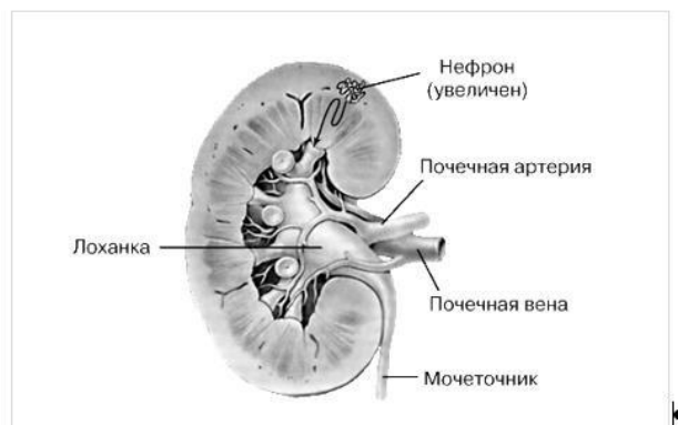
Рис. 1.3. Почки человека (продольный разрез)

Если в работе приведена одна иллюстрация, то ее не нумеруют и слово "Рис." не пишут.